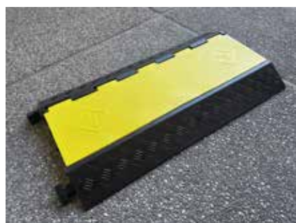
PASSACAVO AMSTERDAM CHIUSO

POSSIBILITÀ DI FISSAGGIO A TERRA tramite tasselli (esclusi) nei 4 fori predisposti.