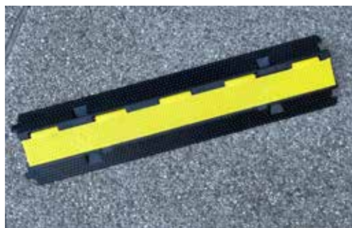
PASSACAVO VENEZIA CHIUSO

POSSIBILITÀ DI FISSAGGIO A TERRA tramite tasselli (esclusi) nei 4 fori predisposti.