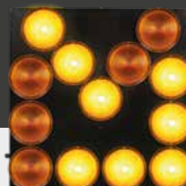
DIMENSIONI 90x90 cm