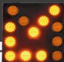
DIMENSIONI 60x60 cm